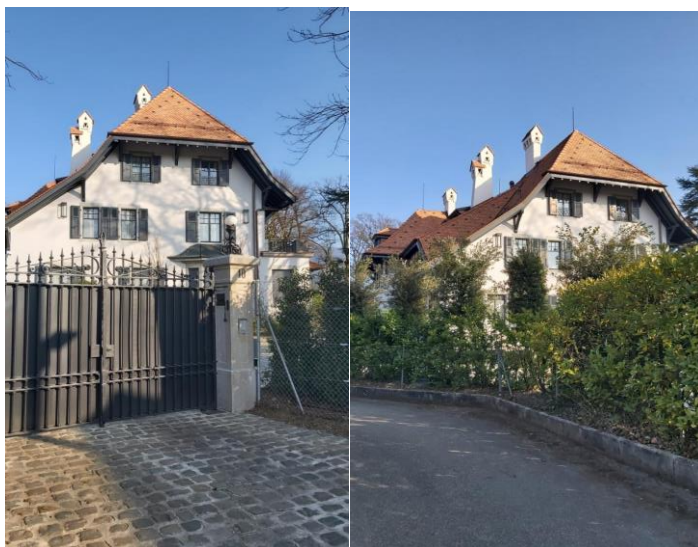
chemin du Vieux-Clos